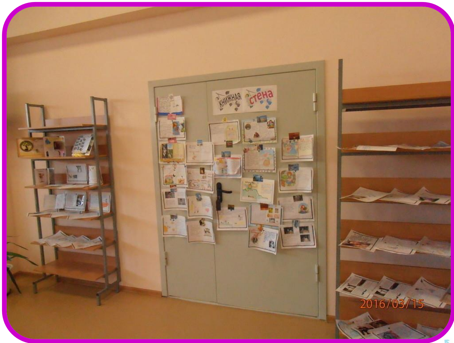
Выставка отзывов в библиотеке